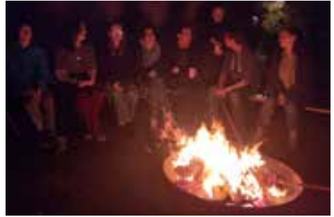
Das traditionelle Lutherfeuer der Jugend am Freitag vor dem Reformationstag mit Stockbrot

20.01. Unkosten 5,- €. Nur mit schriftlicher Anmeldung möglich.